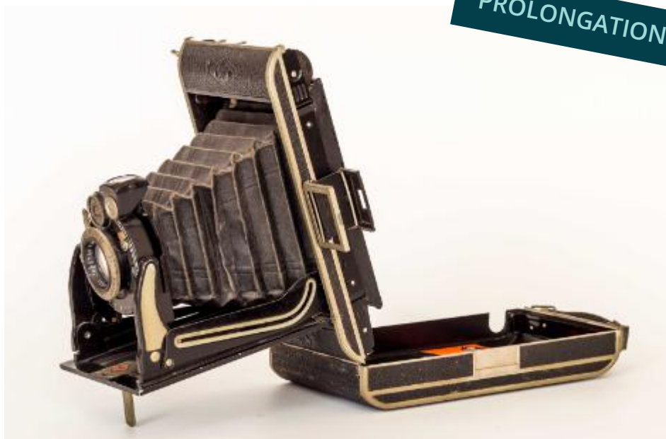
Agfa Billy-Record, 1950, Collection Dumont - PH.DM.12 Musée de la Chartreuse, Photothèque Augustin Boutique-Grand, Douai

Entre septembre 2026 et septembre 2027, le ministère de la Culture appelle à une grande manifestation populaire et festive pour le Bicentenaire de la Photographie sous toutes ses formes.