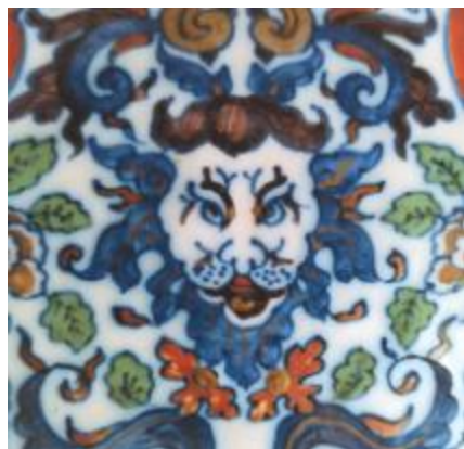
Manufacture Het Moriaenshoofd, Vase couvert de Delft