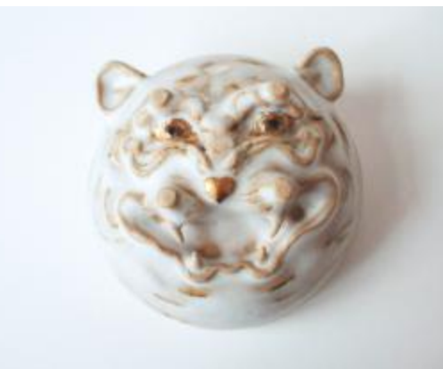
QI HUI HUANG, Chine / France Modelage - grès, émaux, or - four électrique