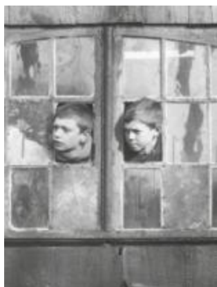
Deux curieux, 19 e siècle, collection Boutique, détail