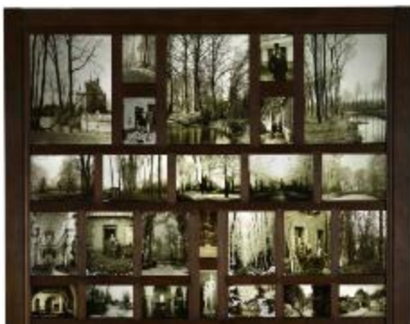
Augustin BOUTIQUE, panneau photographique, détail