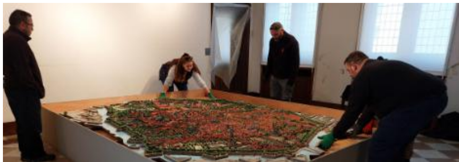
Départ du plan-relief en octobre 2024

Les deux planches de la partie centrale du plan ont quitté Douai en octobre 2024. Elles seront de retour dans leur ville et leur musée pour le printemps 2026 dans une salle totalement repensée que nous avons hâte de vous présenter !