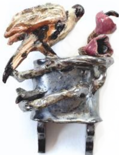
Odile LEVIGOUREUX, Le Chardonneret

Le dialogue entre les arts anciens et les arts contemporains est un petit défi pour les musées qui souvent cloisonnent les disciplines et les domaines. Bousculer les accrochages classiques, chronologiques ou thématiques, en introduisant harmonieusement dans la muséographie de la création contemporaine permet de poser un regard différent sur les accrochages et les œuvres. Cette confrontation d'œuvres parfois séparées par des centaines d'années questionne à la fois la continuité et la rupture dans l'histoire de l'art.