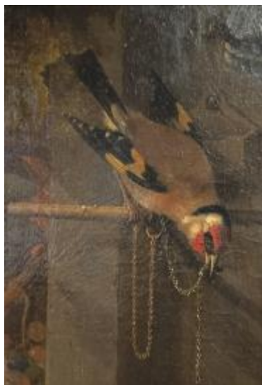
Abraham MIGNON, Nature morte , détail