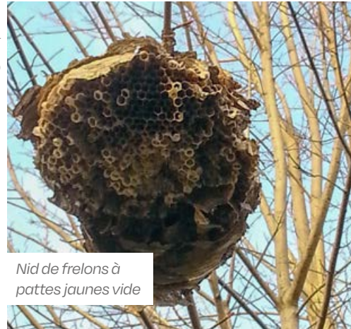
Nid de frelons à pattes jaunes vide