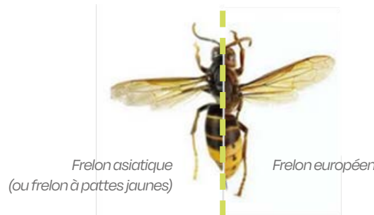
Frelon asiatique (ou frelon à pattes jaunes)

Souvent localisé dans les cabanons, granges, gouttières, haies, le nid primaire présente un petit fil d'accroche avec un nid de la taille d'une balle de ping-pong.